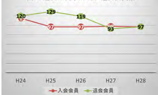
図3 過去5年間の入会・退会会員数