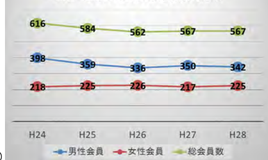
図2 過去5年間の会員数の推移