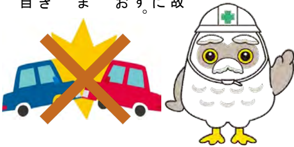
過去5年の事故発生件数

尚、安全対策もされず事故を起こした作業員に対しては、安全推進部での検証のうえ、就業禁止等の厳しい処分をします。また、悪質な事故例の場合、保険の適用外にすることも検討中です。