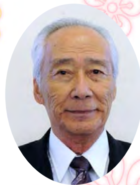
伊東市シルバー人材センター 理事長