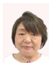
監事 團 さか江

この一年、皆様が「会員になって良かった」と思っていただけけるよう努力してまいりますので、ご協力よろしくお願い致します。