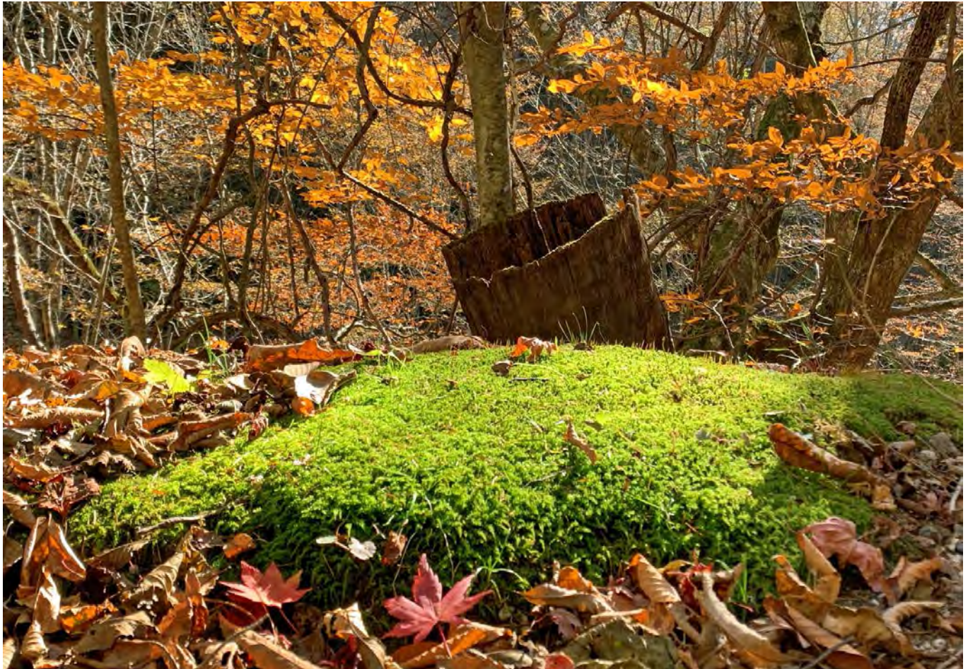
西沢溪谷(山梨)の秋